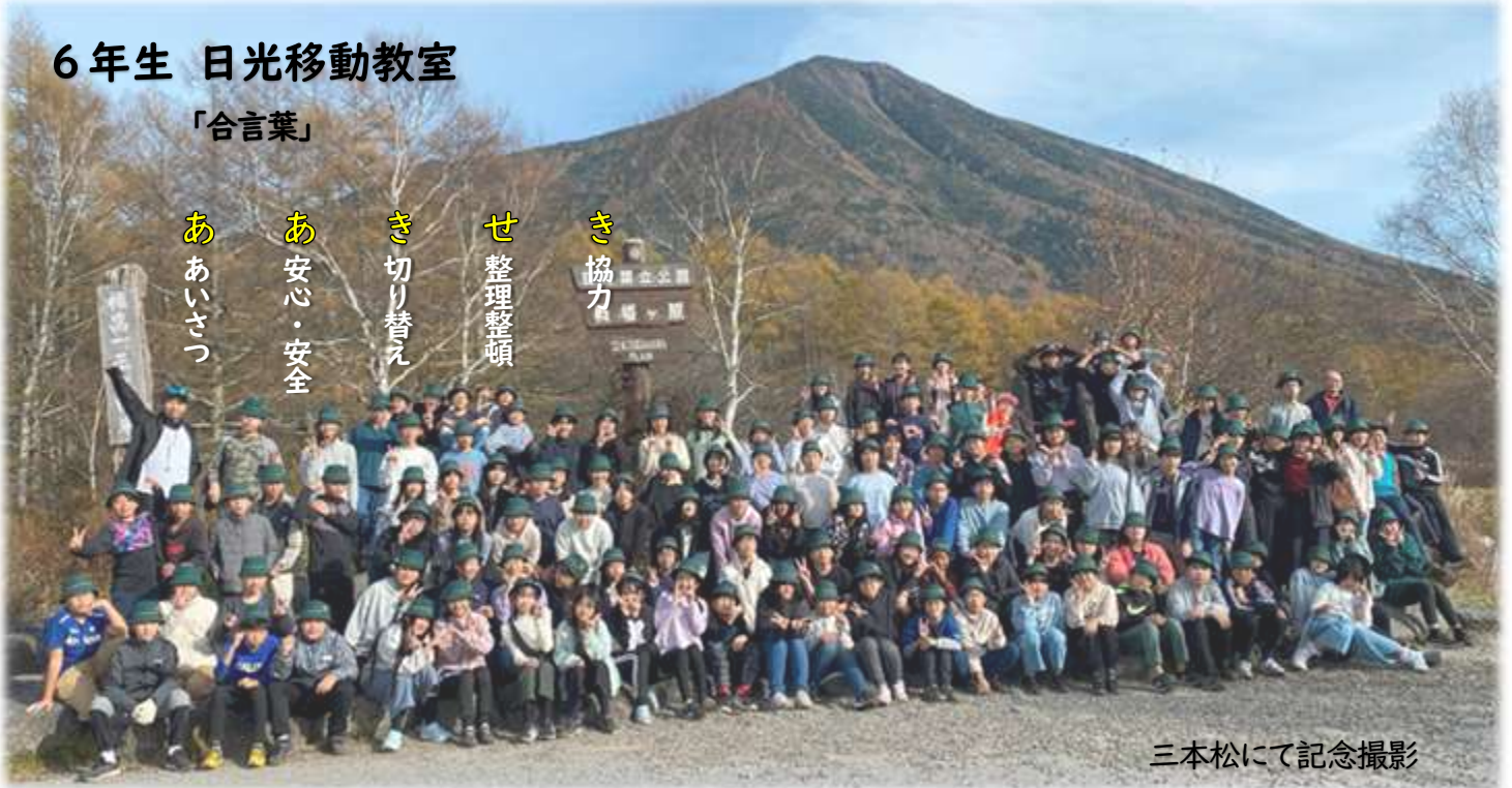
三本松にて記念撮影

10月30日(水)から11月1日(金)の3日間に、6年生が日光移動教室を行いました。